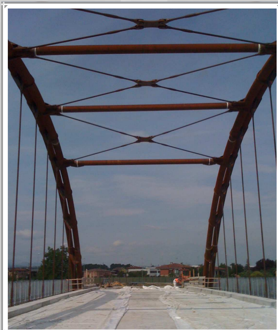
Completamento tangenziale sud nel tratto tra il torrente Rovacchia e l'incrocio di Cabriolo